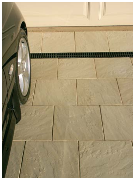
SOLS DE GARAGE, ABORDS DES PISCINES, CARRELAGES

3 à 5 m 2 / L selon la porosité du support.